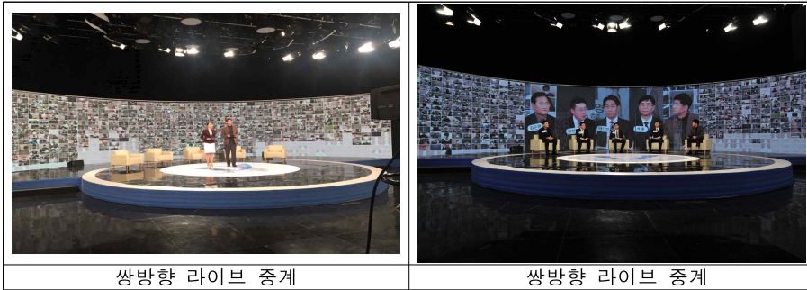
쌍방향 라이브 중계